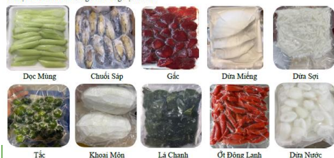
Độc Măng Chuối Sáp Gấc Dưa Miếng Dưa Sọt Tắc Khoai Môn Lá Chanh Ốc Đông Lạnh Dưa Nước